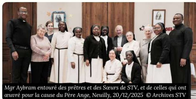
Mgr Aybram entouré des prêtres et des Sœurs de STV, et de celles qui ont œuvré pour la cause du Père Ange, Neuilly, 20/12/2025

Samedi 20 décembre 2025, les bénévoles qui ont aidé aux travaux de la phase diocésaine de la cause ont été conviés pour un déjeuner festif et marquer les 50 ans de prêtrise de Mgr Aybram.