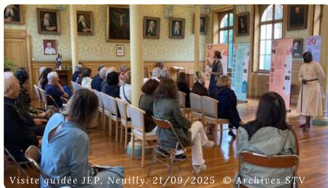
Visite guidée JEP, Neuilly, 21/09/2025

De plus, nous avons présenté l'histoire du château au Réseau Saint-Thomas de Villeneuve de passage.